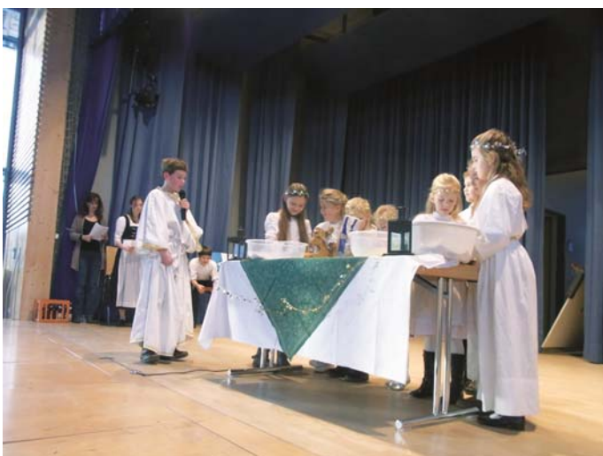
Rossholzender Trachtenkinder bei ihrem Theater „Der verlorene Himmelschlüssel“