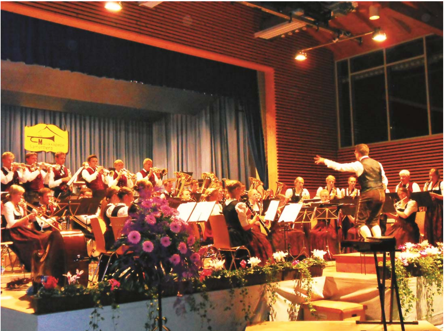
Neben den beliebtesten Stücke der letzten zehn Jahren waren beim Herbstkonzert der Musikkapelle Samerberg auch neue Werke zu hören.