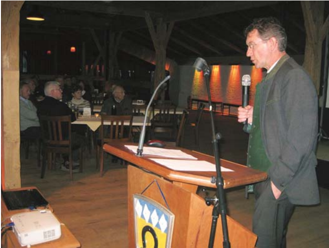
Erster Bürgermeister Georg Huber

Nur wenige Wortmeldungen gab es nach dem umfangreichen Rechenschaftsbericht von Bürgermeister Georg Huber bei der Samerberger Bürgerversammlung im Moarhof in Roßholzen. Thematisiert wurden unter anderem die weitere Entwicklung der Schwimmbäder in der Filze und in Roßholzen