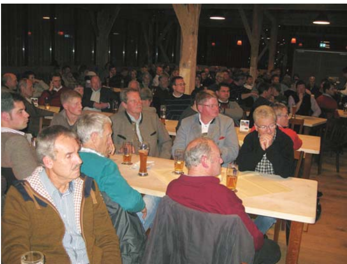
Blick in die Versammlung