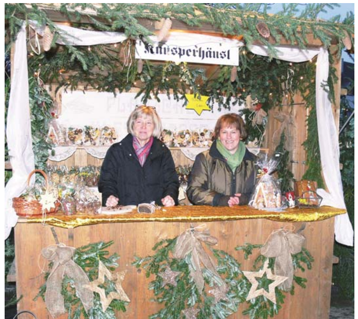
Immer freundlich: Das Verkaufspersonal auf den vielen Ständen.