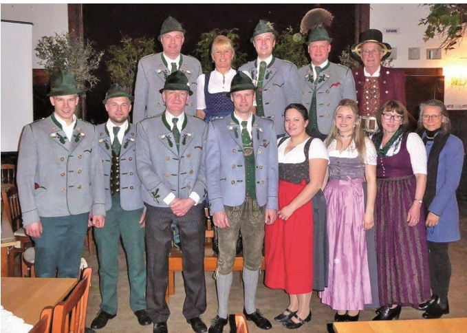
Die neue Vorstandschaft des Trachtenvereins Hochries-Samerberg