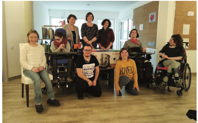
In der hinteren Reihe die drei Damen von der Frauengemeinschaft und die erfreuten Jugendlichen