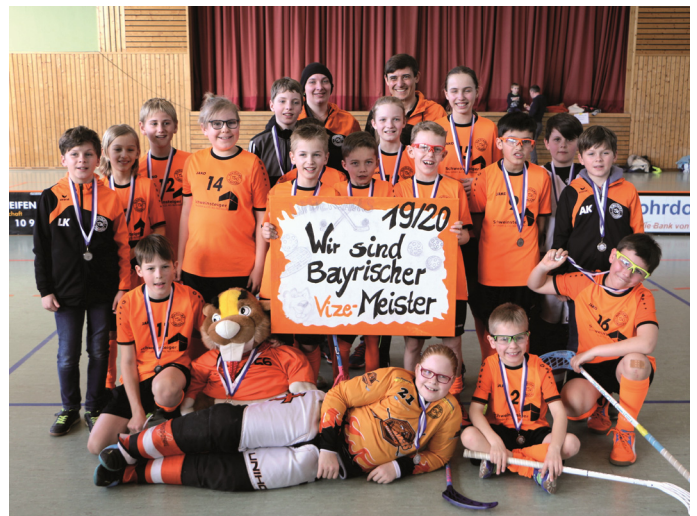
Text/Foto: TSV Rohrdorf-Thansau, Abt. Floorball

Alles in allem eine rundum erfolgreiche Floorball-Saison!