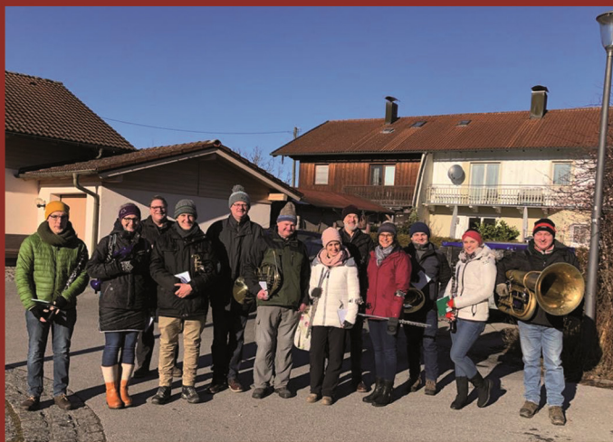
Die vier Gruppen des Neujahrsanblasens 2019

Text: Förderverein der Musikkapelle Rohrdorf