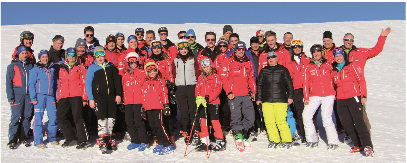
Gute Stimmung beim Sparkassen Cup in Scheffau

Das Jubiläum zum 150-jährigen Bestehen des Krieger- und Veteranenvereins wird heuer am 10. Mai mit einem Festgottesdienst auf dem Dorfplatz in Roßholzen gefeiert, gab Vorsitzender Deindl bekannt. Eingeladen werden sollen dazu die umliegenden Veteranenvereine sowie die Samerberger Ortsvereine. Zum Festausklang am 11. Mai ist am Abend ein Kesselfleischessen mit der Vetternmusi und dem Gstanzlsänger Erdäpfelkraut vorgesehen. Anlässlich des