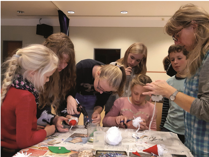
Basteln für den Adventsmarkt

werden, 500 Euro gingen ans Kinderheim in Fürstätt, 800 Euro an die SAPV Rosenheim und 500 Euro erhielt die Frauengemeinschaft Lauterbach für die anstehende Renovierung ihrer Vereinsfahne. Die Lauterbacher Kinder zeigten ebenfalls Einsatz und hatten einen eigenen Stand mit ihren selbstgebastelten Sachen. Sie konnten 250 Euro für die Aktion Sternstunden einnehmen. Im Rahmen des Adventsmarktes bestand auch die Möglichkeit Hilfspakete für die Aktion „Junge Leute helfen e.V.“ abzugeben. Hierfür konnten schließlich 40 Pakete und 250 Euro gesammelt werden.