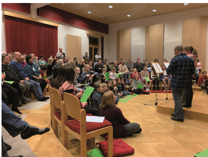
Die Zuhörer im vollbesetzten Musikheim lauschten den stimmungsvollen und weihnachtlichen Melodien

Redaktionsschluss für redaktionelle Beiträge in der Märzangabe: Mittwoch, 12. Februar 2020 rsz@rohrdorf.de rsz@samerberg.de