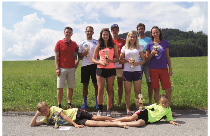
Die Olympics-Sieger der 2018-Serie

Die Verantwortlichen des WSV Samerberg freuen sich auf ereignisreiche und gesellige Breitensportveranstaltungen und hoffentlich viele Teilnehmer!