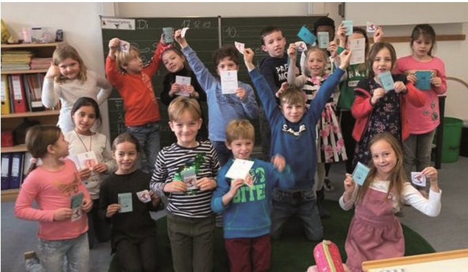
Die Kinder mit ihren Abzeichen

Seit den Herbstferien übte die Klasse 2b jeden Freitag fleißig Schwimmen im BernaMare. Der Fleiß wurde nun belohnt. 5 Seepferdchenabzeichen und 9 Jugendschwimmabzeichen in Bronze konnten die Kinder in Empfang nehmen. Vielen herzlichen Dank an die Eltern die uns zum Schwimmunterricht gefahren und unterstützt haben.