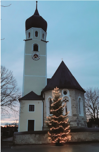
Christbaum am Dorfplatz