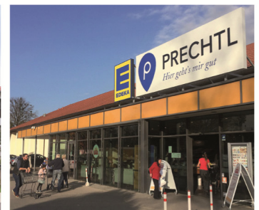
Die Edeka-Prechtl-Märkte in Raubling, Bad Aibling, Brannenburg und Bad Feilnbach überzeugen mit einem hochwertigen Sortiment, bester Qualität, Nachhaltigkeit und Service.