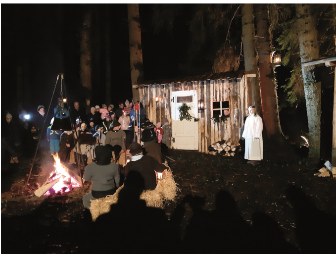
Der Engel erscheint den Hirten