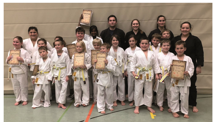
Auf dem Bild sind die 17 Prüflinge, das Prüfungskomitee sowie die Trainer auf dem Weg zum Weiß-Gelb-Gurt zu sehen