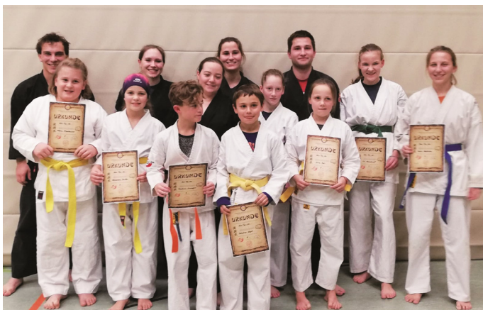
Die neu geprüften Kampfsportler mit dem Prüfungsvorstand inkl. Beisitzer

Im Dezember stand im Dojo Rohrdorf eine Farbgurtprüfung an. Hierbei versuchten acht Kämpfer den nächsthöheren Gürtel durch ihr Können zu erreichen. Alles begann wie bei jeder Prüfung. Nach den grundlegenden Konditionsübungen sowie ein paar Techniken zum Grundwissen startete man mit der Kata. Dies ist ein Kampf gegen einen oder mehrere imaginäre Gegner in festgelegter Reihenfolge.