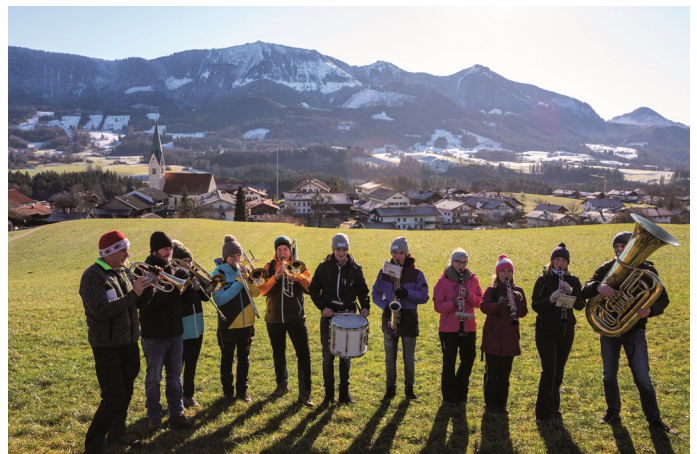
Eine der vier Gruppen zum Neujahrsanblasen mit Törwang und der Hochries im Hintergrund.

Text: Hötzelberger